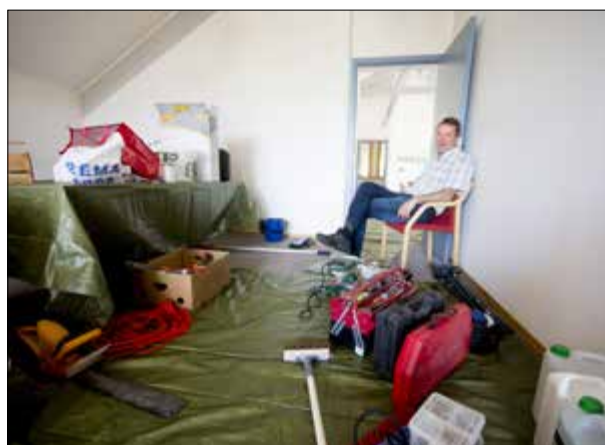
Mye arbeid gjenstår, men 1. oktober skal Veksthuset være mer enn innflyttingsklar.