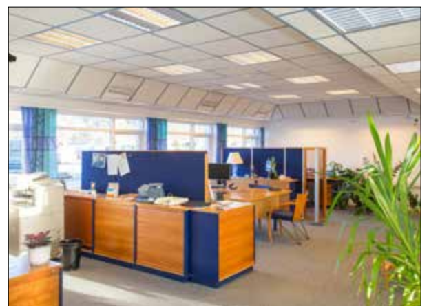
Kontorplassene er allerede klare for bruk i førsteetasje.